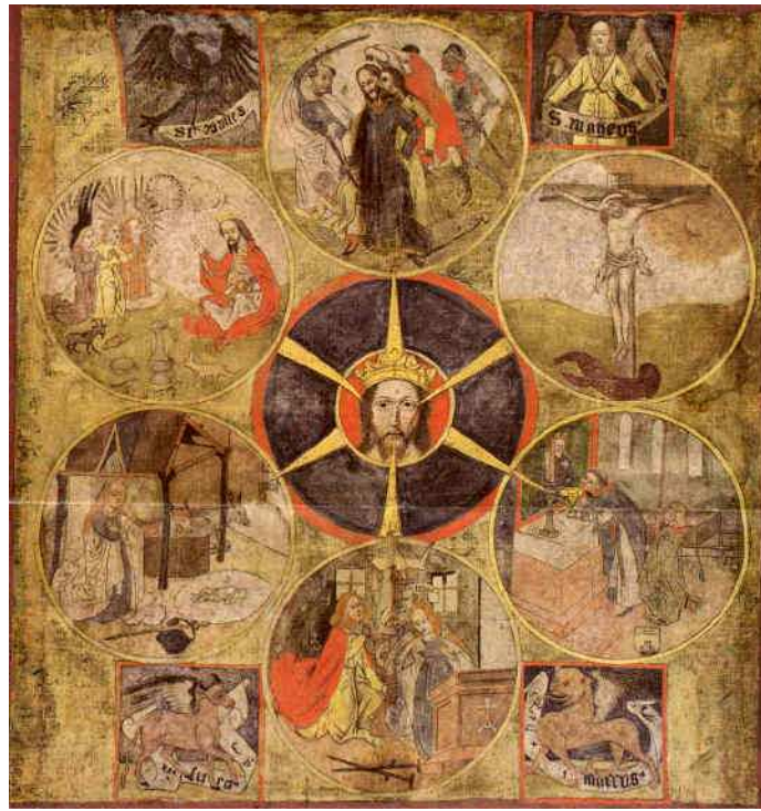
Nicolas de Flue, Vision de la Vérité