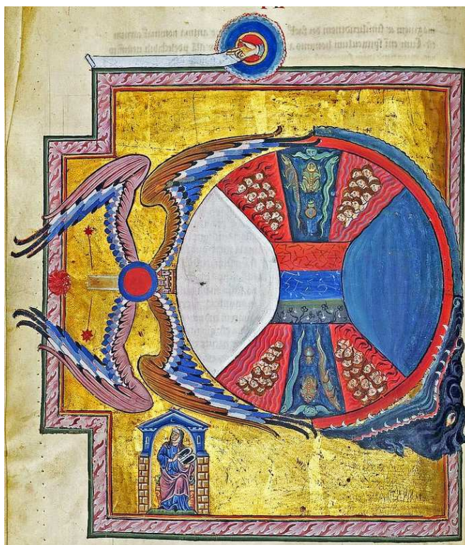
Hildegard von Bingen

Accompagné d'une lecture symbolique de la Madeleine de Vézelay.